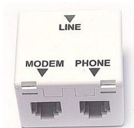
شکل ۱ - اسپلیتر

بنابراین برای استفاده از هر دستگاهی که قرار است به صورت مستقیم بر روی خط وصل باشد، یک اسپلیتر نیاز است.